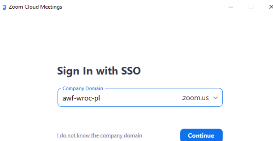
Rysunek 5: Adres SSO.

4. Podać adres SSO awf-wroc-pl.zoom.us (rys. 5).