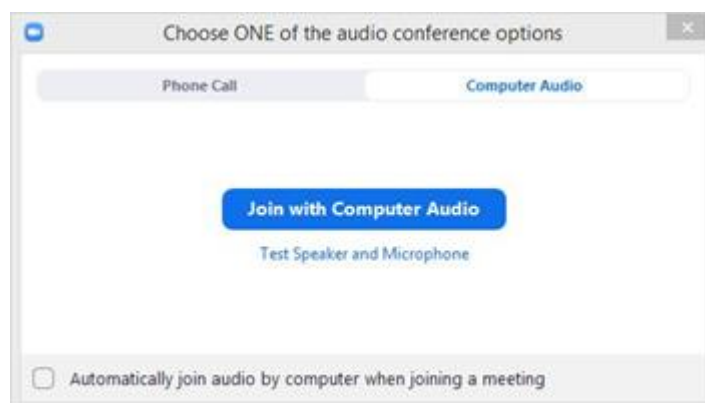
Rysunek 3: Wybór opcji audio.

W przypadku aplikacji zainstalowanej na telefonie / tablecie, na ekranie pojawi się widok poczekalni. Należy wówczas poczekać, aż prowadzący zaakceptuje nawiązane połączenie. Po akceptacji należy kliknąć Call using Internet Audio .