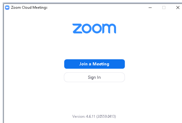
Rysunek 1: Logowanie do klienta Zoom.