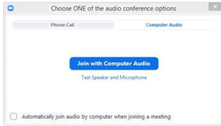
Rysunek 6: Wybór opcji audio.